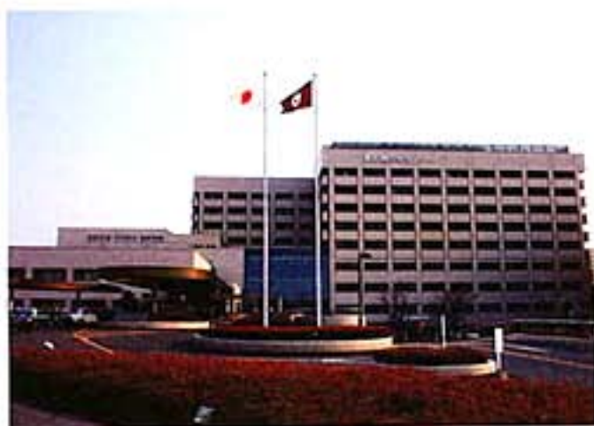
愛知県がんセンター中央病院は診療科を超えた、チーム医療で早期発見と早期治療を実践している。

ず禁煙を」と最初に禁煙を約束させる。手術前に化学療法を実施し、腫瘍を小さくしてから食道がんの手術へと向かうことになる。